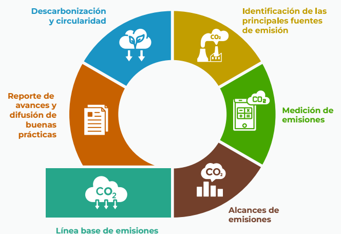
Figura 1. Ciclo de Descarbonización del Sector de Turismo

*Descarga la Guía de Acción Climática y Circularidad en la web del proyecto Turismo Circular Perú a partir de Enero 2026.